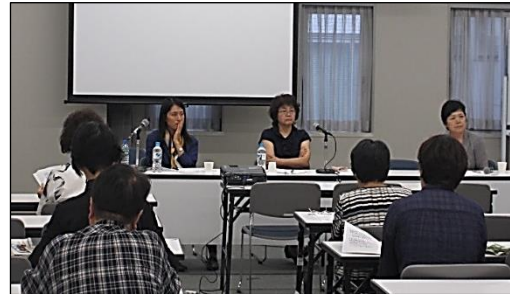
「女性と人権」講座 福島からの母子避難とジェンダー