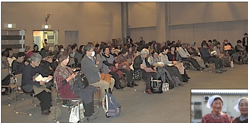
男女共同参画推進せんだいフォーラム 2016 映画とトーク「飯舘村の母ちゃんたち 土とともに」