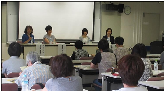
「女性と人権」講座 無業の若年女性の現実と自立支援